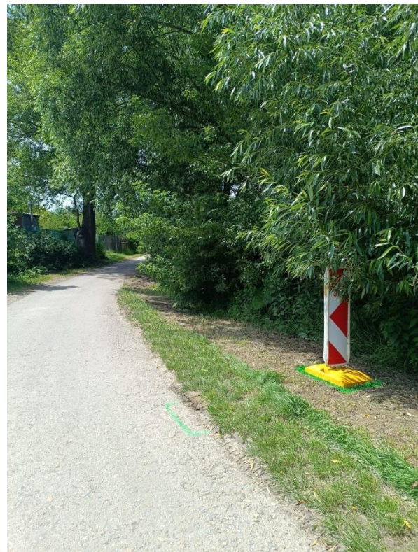
Page 1-16 (13,15 km), str. 1-16 (13,15 km).