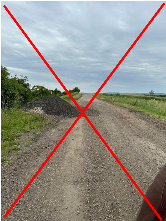
Page 2-41, str. 2-41

RZ 9/12 - Úprava levé strany vozovky v úseku mezi km 5,11-5,70 (Itinerář str. 2-41, poz. č. 9 a poz. č. 10)