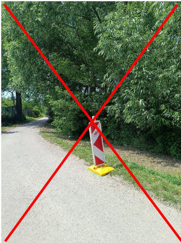
Page 1-16 (13,15 km), str. 1-16 (13,15 km).

RZ 1/4 - Změna umístění antikatu v úseku mezi km 12,87-13,46 km (Itinerář str. 1-16, poz. č. 21 a. č. 22).